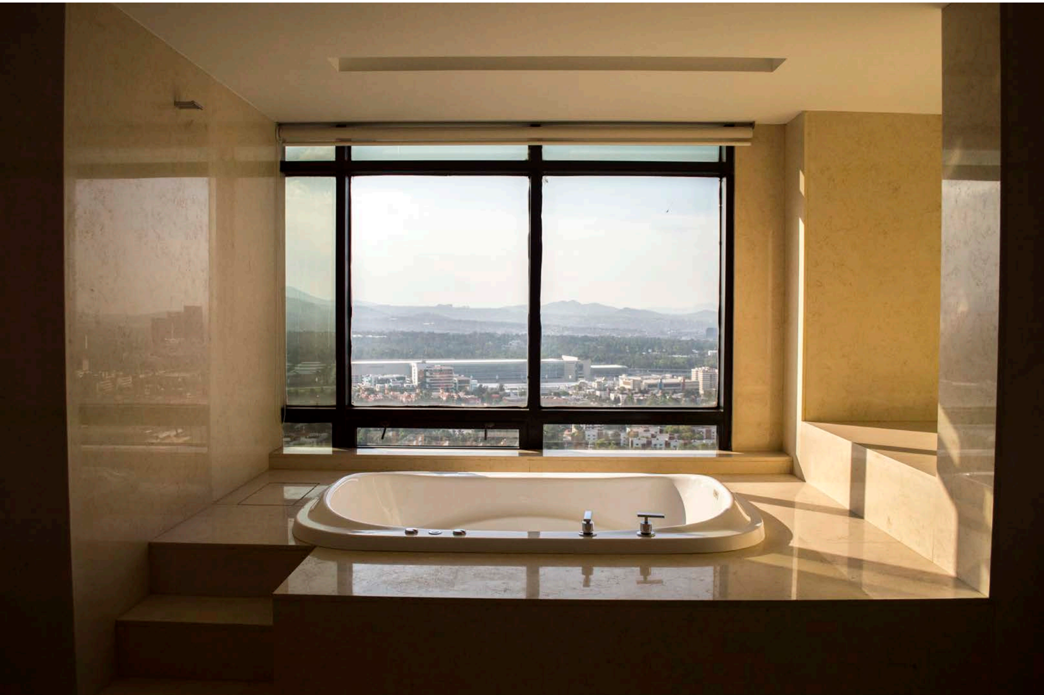
Baño Recámara 1 (Principal)