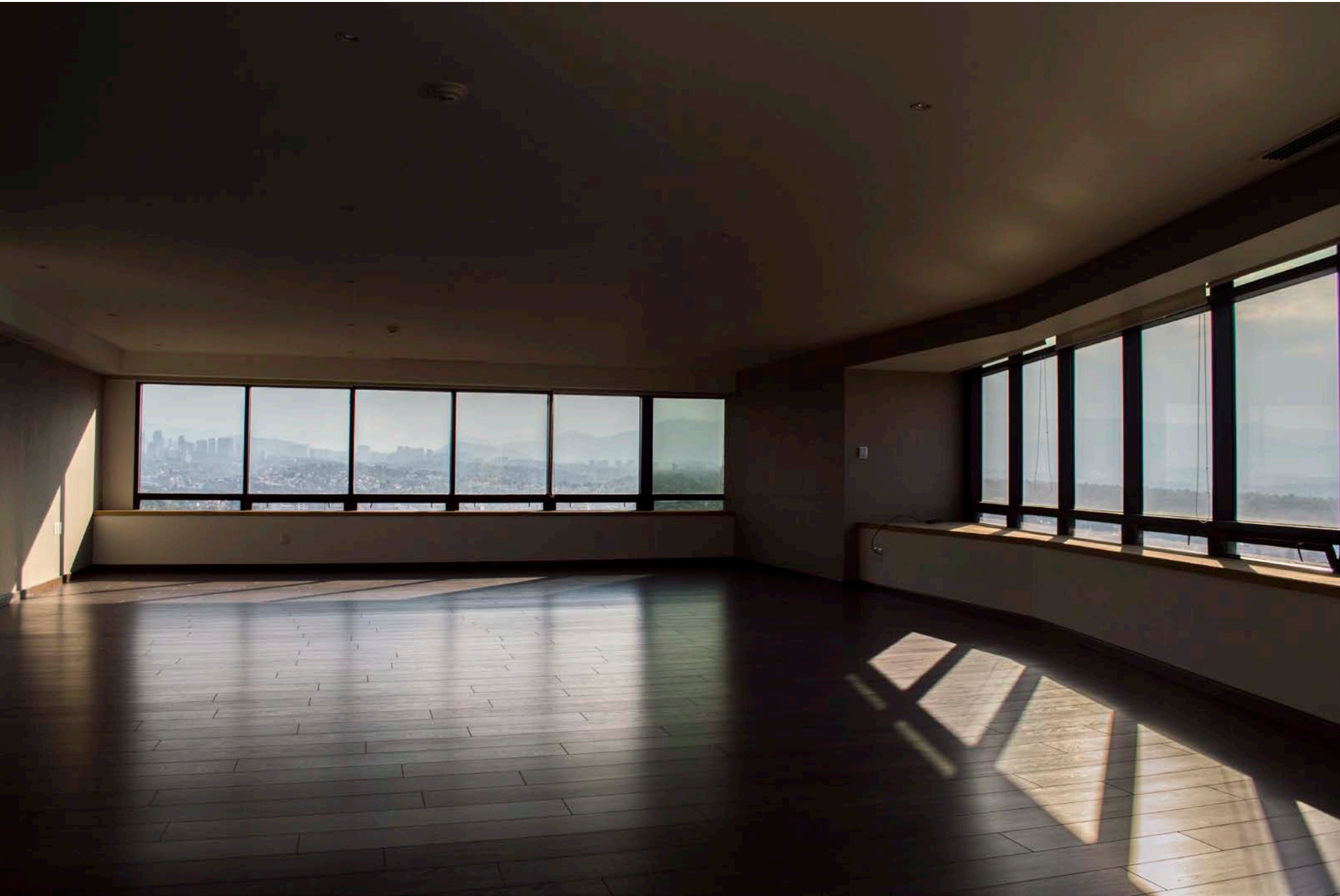
Recámara 1 (Principal)