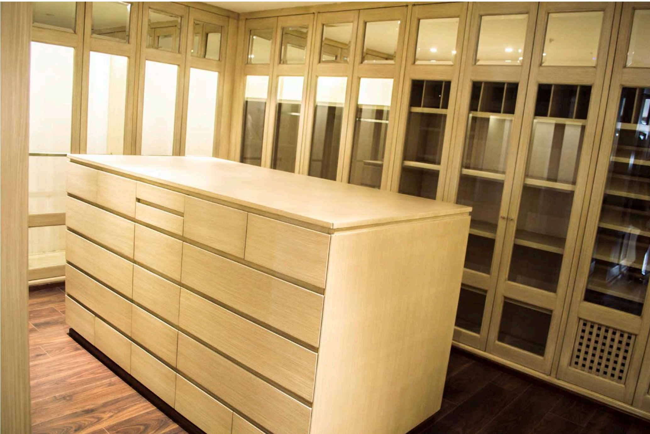
Vestidor Recámara 1 (Principal)