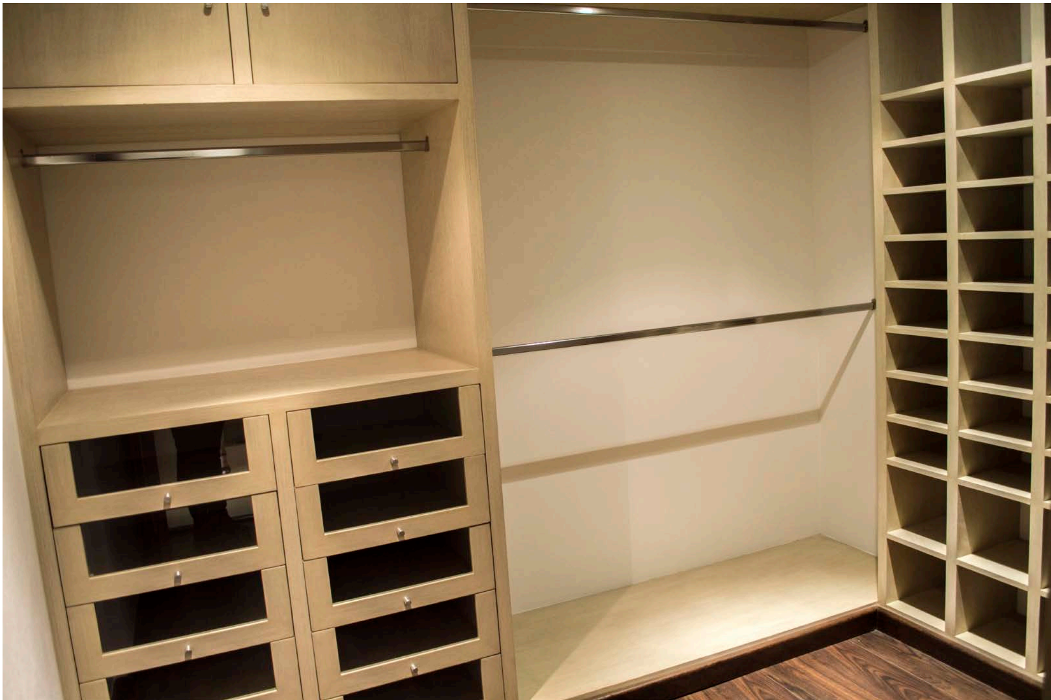
Vestidor Recámara 2